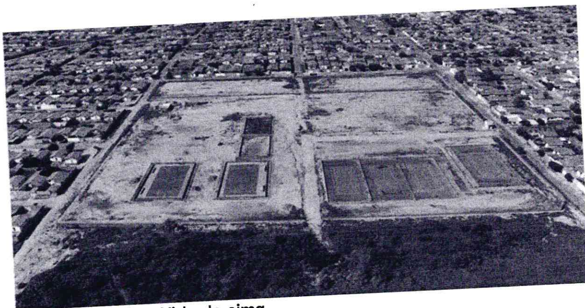
Construção atual – Vista de cima