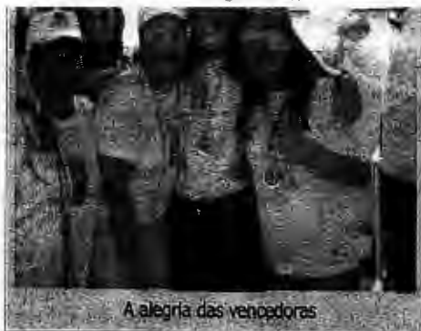
A alegria das vencedoras