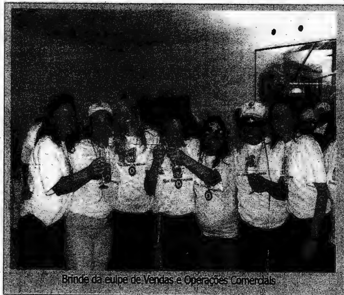
Brinde da equipe de Vendas e Operações Comerciais