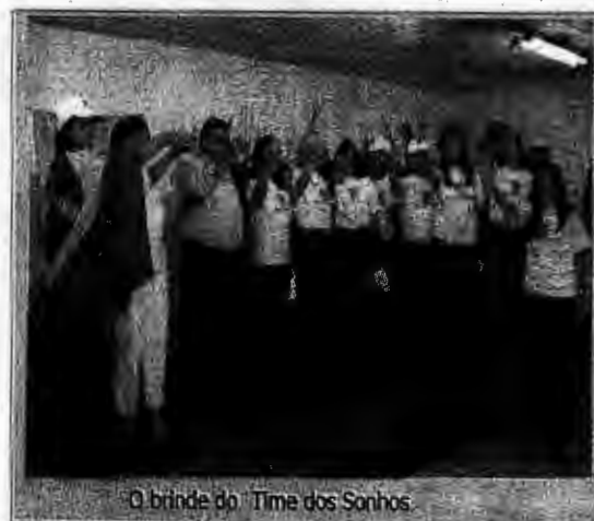
O brinde do Time dos Sonhos