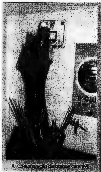
A comemoração da grande campeã