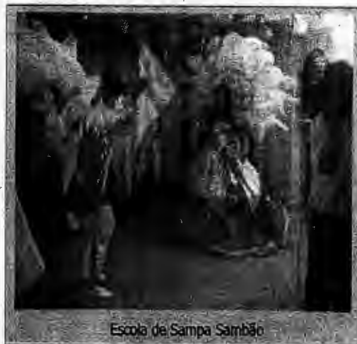
Escola de Samba Samba