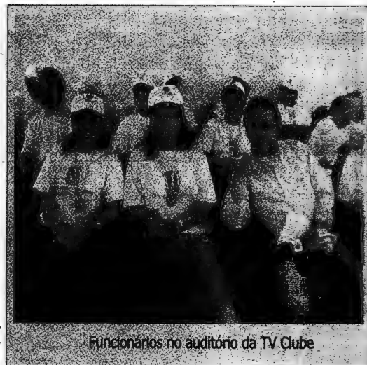
Funcionários no auditório da TV Clube