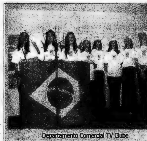
Departamento Comercial TV Clube