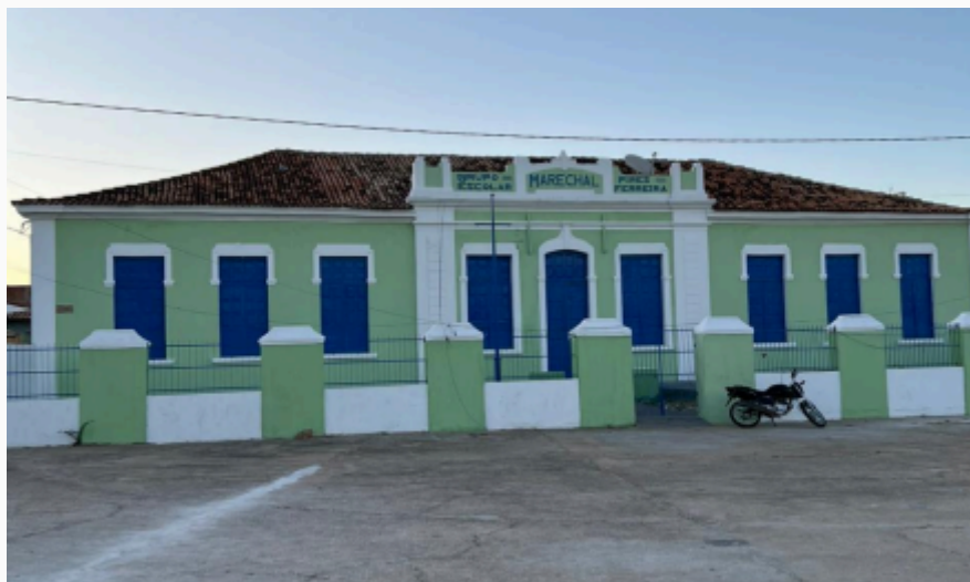
Imagem da Fachada Principal

Em amarelo, área total referente ao antigo Grupo Escolar Marechal Piros Ferreira, que hoje encontra-se separada da edificação principal, marcada em vermelho, por um muro. Em verde, o DETRAN.