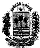
TABELA II TÉCNICO DE FISCALIZAÇÃO AGROPECUÁRIA