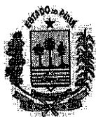
TABELA I FISCAL ESTADUAL AGROPECUÁRIO